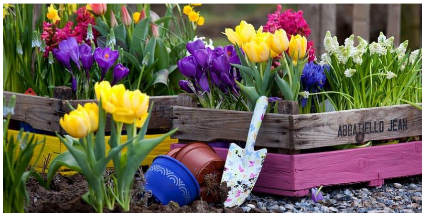
De tuin in de lente

Op de website www.ikwoonleefzorg.nl vonden we de volgende informatie die hulp kan bieden bij de aanschaf.