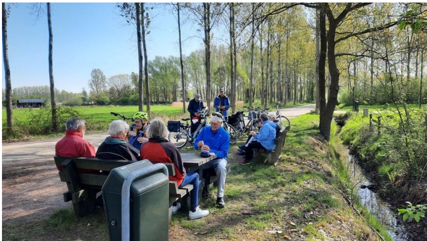
Impressie tussenstop fietsclub (MS&BK 1 nov 2023)

Ook het jaarlijkse etentje, dit keer met 23 personen in De Zwaan, is inmiddels weer achter de rug.