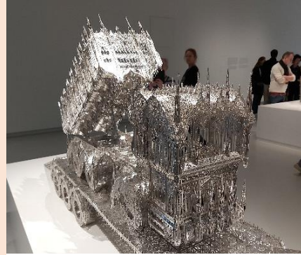
Expositie in het Noord-Brabants museum

De entree is voor eigen rekening. Veel leden maken daarom gebruik van de Museumkaart. Nadere informatie vindt u op de website van de PVGE of bij de bestuursleden.