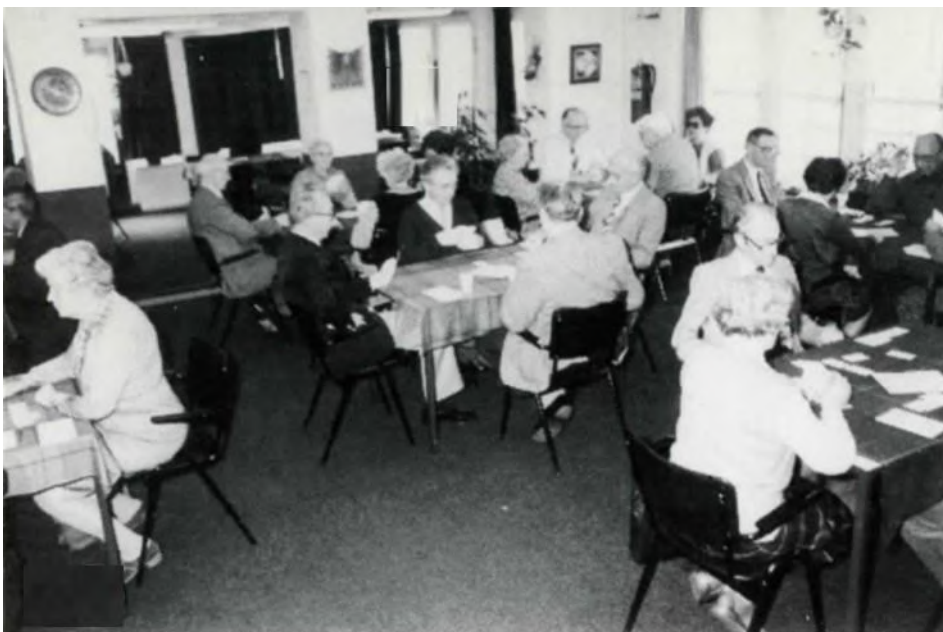
Bridgen in het restaurant van “de Schouw”.