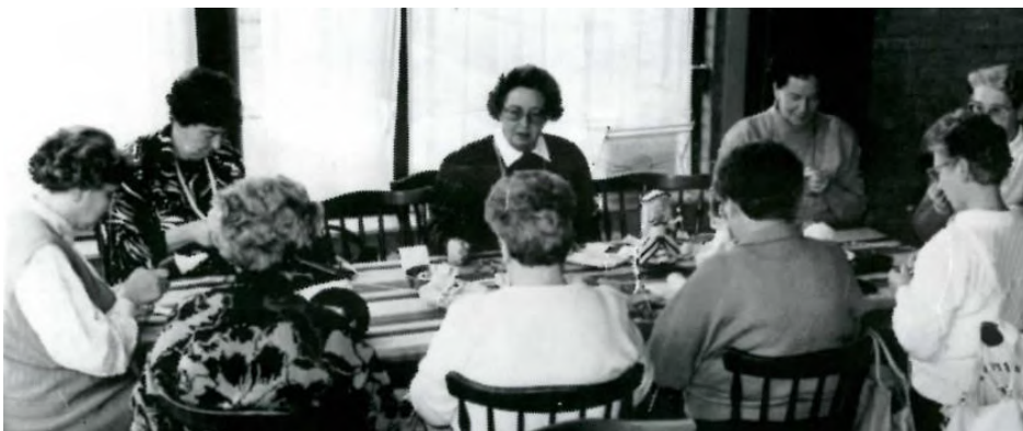
Veldhoven had een handwerkclubje voor vrouwen, dat zeer geslaagde artikelen heeft vervaardigd.