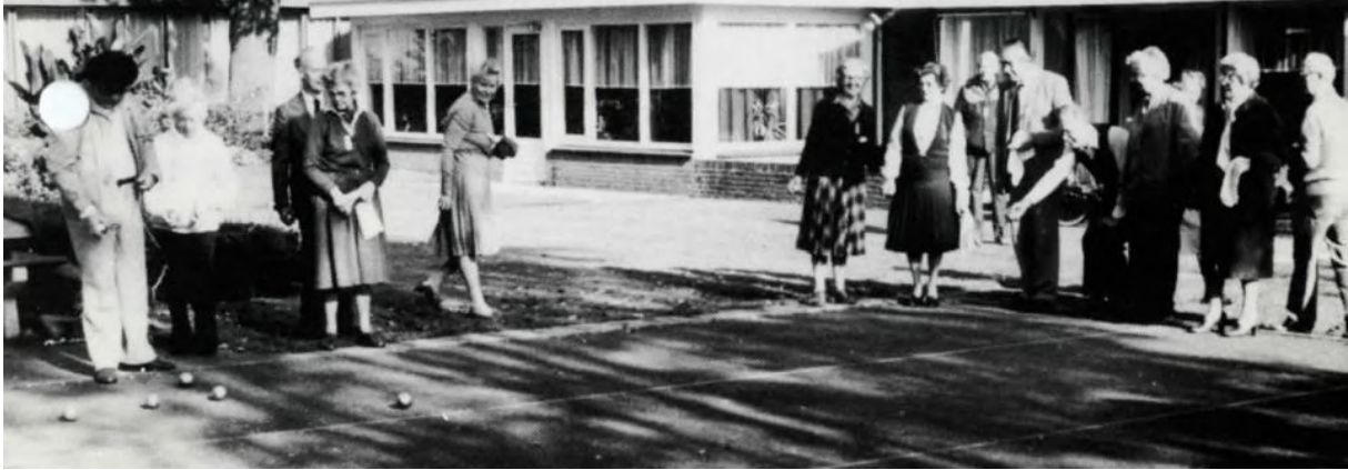
Jeu-de-boules op de banen in de achtertuin van “de Schouw”.