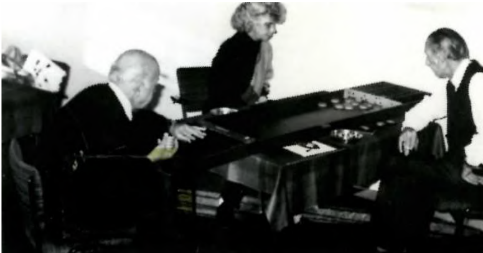
Elke donderdagmiddag konden de liefhebbers van het sjoelen naar hartenlust hun stenen schuiven.