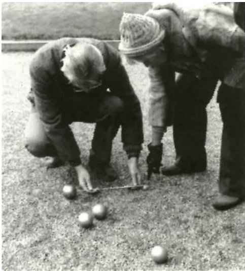
Metten is weten...