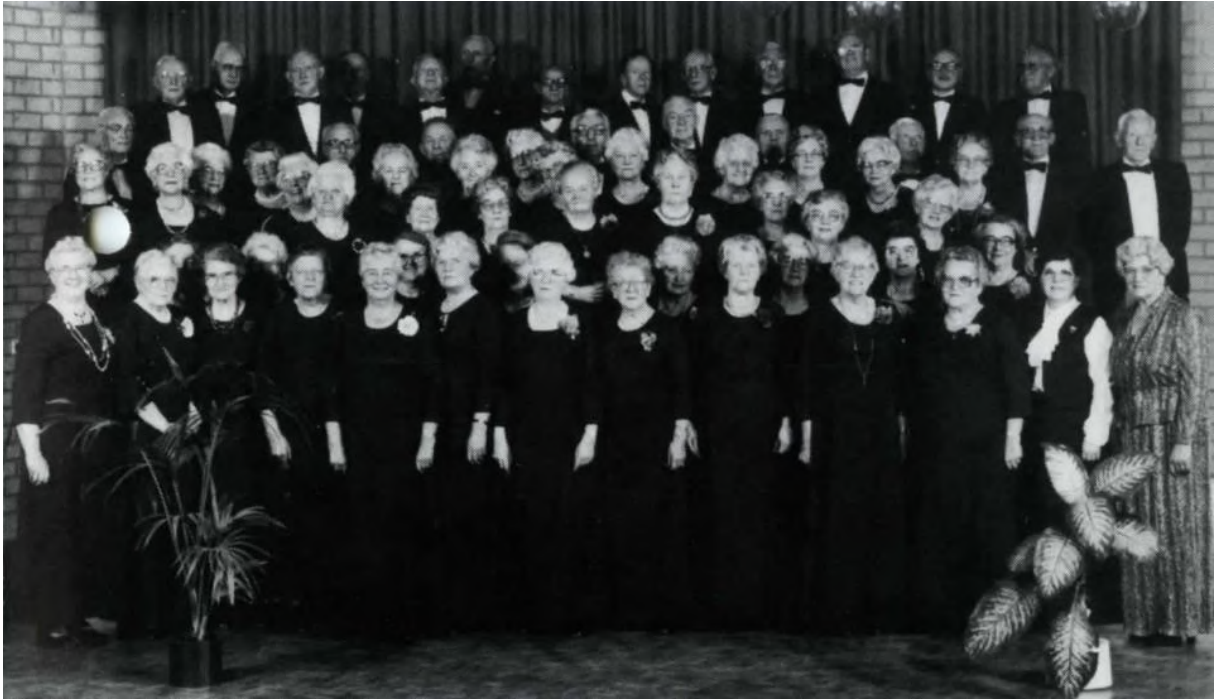
Het "Lichtstadkoor" in vol ornaat, vlak voor een optreden.