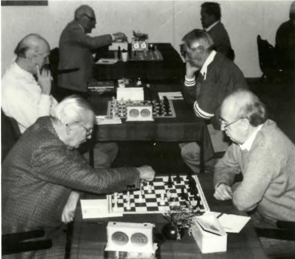
De schaakclub “Brainpower” was iedere woensdagmiddag actief.