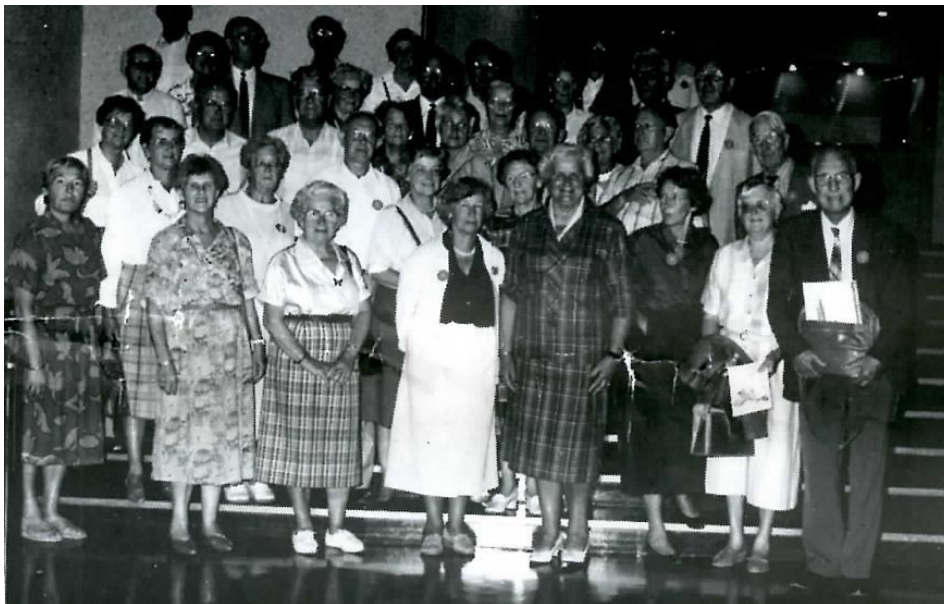
Groepsfoto van de reis naar Straatsburg in 1988

Tegenwoordig zijn er voor iedereen meer reismogelijkheden, maar velen vinden het gemakkelijk wanneer alles geregeld en begeleid wordt om met vertrouwde leden op stap te gaan. In 2007 organiseerde het reisbureau eenendertig verschillende reizen voor 1700 leden. Inmiddels hebben de lokale verenigingen eigen reisgroepen. Deze organiseerden in 2007 zesenvijftig reizen voor zo’n 3000 personen.