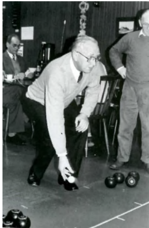
Geldrop had koersballen op het programma staan.