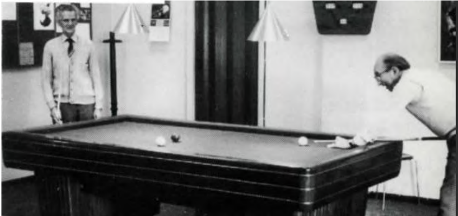
De biljarters waren dagelijks actief op een van de vier biljarts.