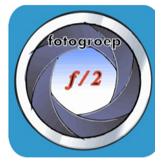
Foto-expositie van f/2

Op 18 en 19 maart is in 't Kwetternest een fototentoonstelling door de leden van fotogroep f/2.