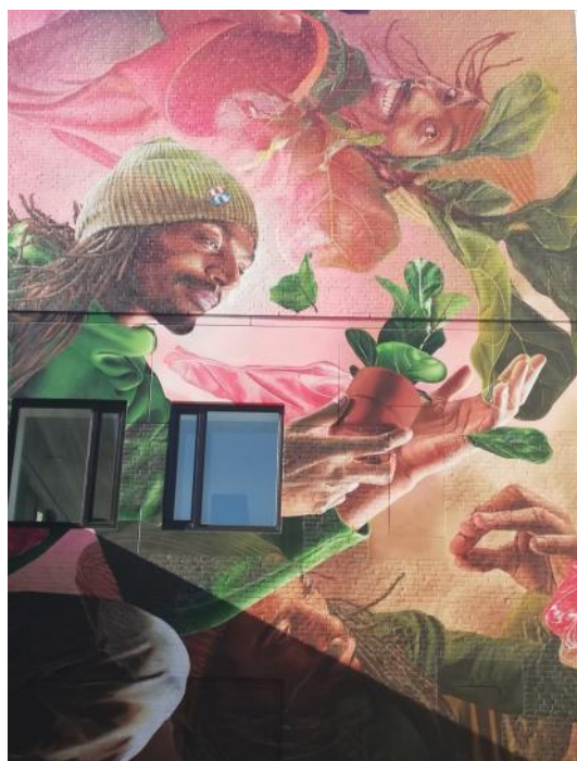
5. In de buurt van het CKE vindt je dit enorme project van Studio Giftig. Opgedragen aan een beroemde rapper met plantenliefde!

Als je de straat- of viaductnamen van deze vijf muurschilderingen gevonden hebt, vormen de eerste letters ervan een woord.