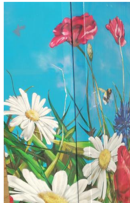
3. Ook Cazone laat ons genieten van een spectaculaire bloemenzee in dit viaduct in het westen van Eindhoven.