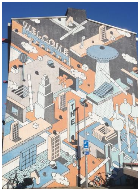
2. Een 'oude' muurschildering rond de Aalsterweg, nodigt uit voor toekomstig Eindhoven...