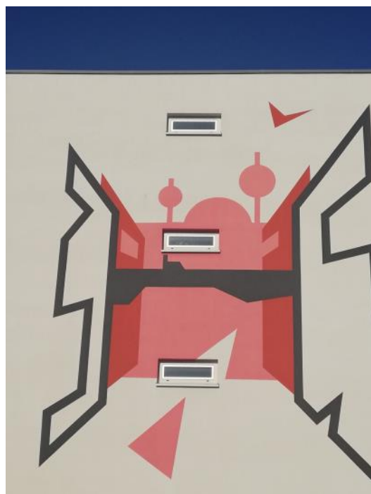
4. Vlakbij een nieuw schoolgebouw in de componistenbuurt vind je deze diepgang op een muur.