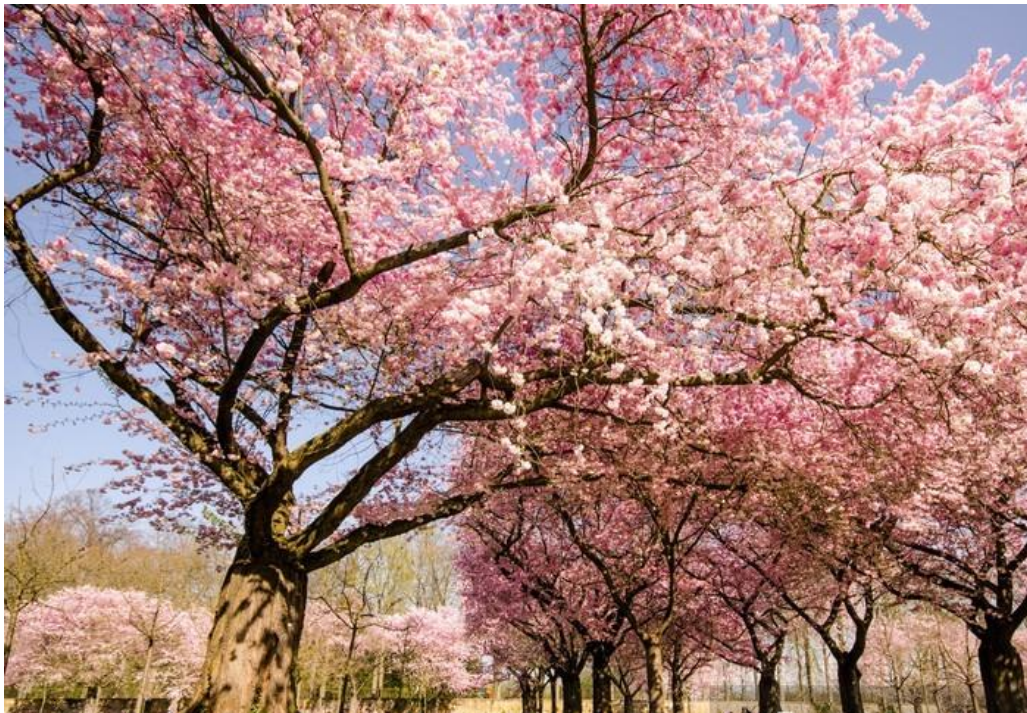
KLEUREN VAN DE LENTE: TUIN MET JAPANSE KERSENBLOESEM